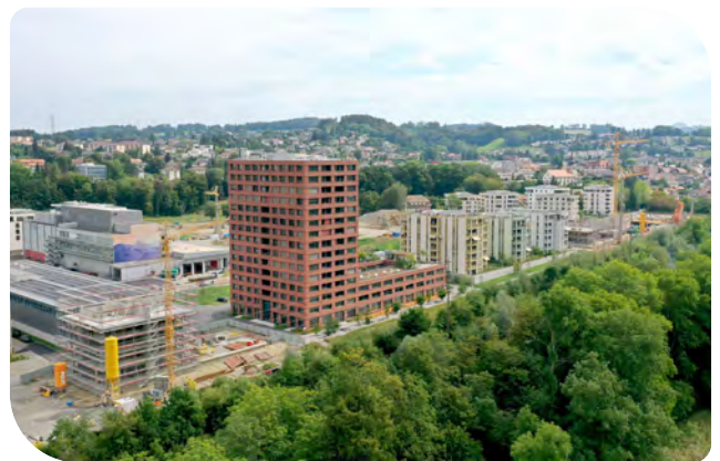
Attendant au campus du Marly Innovation Center (MIC), l'éco quartier a trouvé sa place dans un cadre calme et verdoyant, au bord de la Gérine.